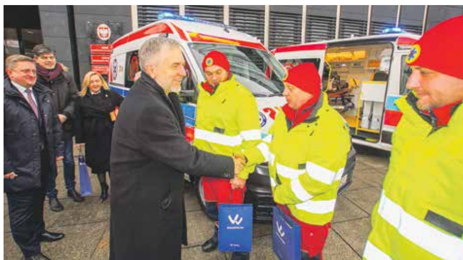
W przekazaniu ambulansów partnerom ze wschodu uczestniczyli Tetiana Jehorowa-Lucenko, przewodnicząca Charkowskiej Rady Obwodowej, oraz Wasyl Zwarycz, ambasador Ukrainy w Polsce.

Nie sposób nie wspomnieć też o dwóch flagowych przedsięwzięciach z dziedziny oświaty, zasilonych dziesiątkami milionów euro z WRPO 2014+: „Cyfrowej Szkole Wielkopolski@ 2020” oraz „Czasie Zawodowców BIS”. Pierwszy projekt (istotny też w kontekście wyzwań nauczania zdalnego) objął 700 szkół, 5040 nauczycieli, 13.280 uczniów; pozwolił zakupić ponad 17.000 tabletów, ponad 3000 laptopów, sprzęt telekonferencyjny, aparaty cyfrowe, drukarki 3D, stacje meteo itd. „Czas Zawodowców BIS” oznaczał m.in.: sta-