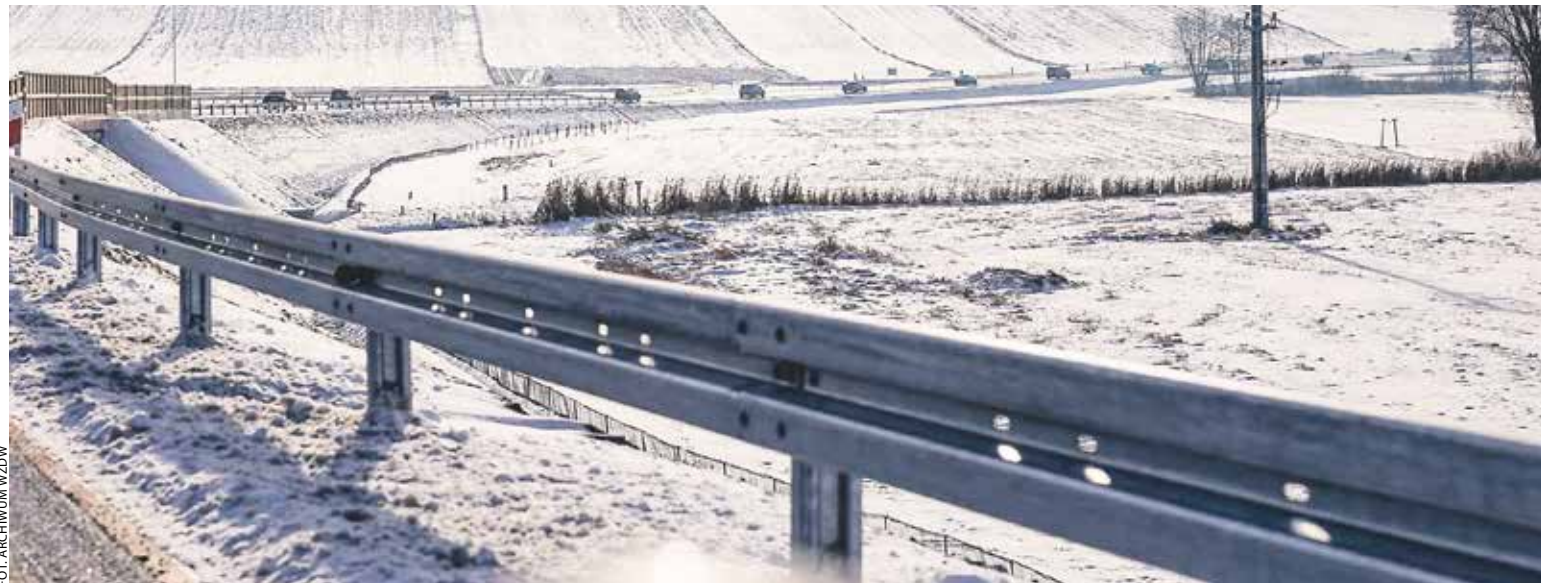
Otwarta w grudniu 2023 roku obwodnica Gostynia to najdroższa i jedna z najważniejszych inwestycji drogowych mijającej kadencji.

Na tę kadencję przypadła zasadnicza część wdrażania WRPO 2014-2020, z jego ważnym komponentem społecznym, a także wojewódzkiego „tortu” Programu Rozwoju Obszarów Wiejskich 2014-2020. Szerzej o efektach naszej 20-letniej obecności w UE, w tym skuteczności wydawania pomocy z Brukseli, będziemy pisać za miesiąc. Teraz ograni-