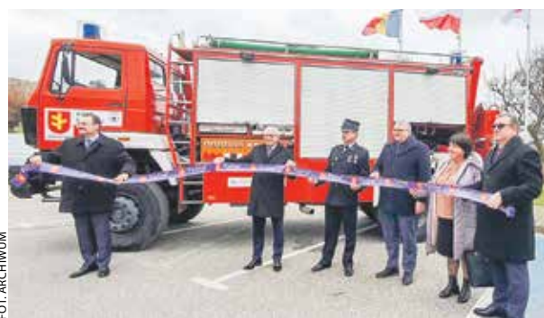
Mołdawianie odebrali podarowany wóz strażacki podczas uroczystości w Rychwale.

13 lutego w Rychwale odbyło się uroczyste przekazanie wozu strażackiego z OSP Grochowy w gminie Rychwał do gminy Zubrești w Republice Mołdawii.