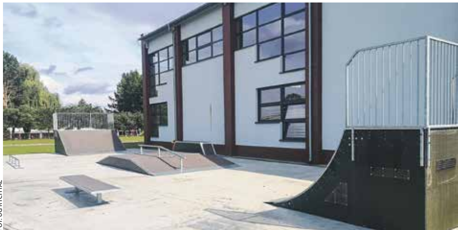
Skatepark w Rychtalu w powiecie kępińskim.

Ponad 2 miliardy złotych otrzymali beneficjenci PROW w naszym województwie.