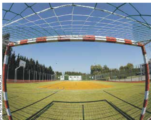
Zdjęcia nagrodzone w czwartej edycji konkursu. Z miejscowości Otorowo w gminie Szamotuły pochodzi praca „Piłkarska kadra czeka”, a fotografię „Meandry rzeki Gwda po podniesieniu się porannych mgieł” wykonano w miejscowości Ługi Ujskie w gminie Ujście.

– Konkurs „PROW w obiektywie” cieszy się coraz większą