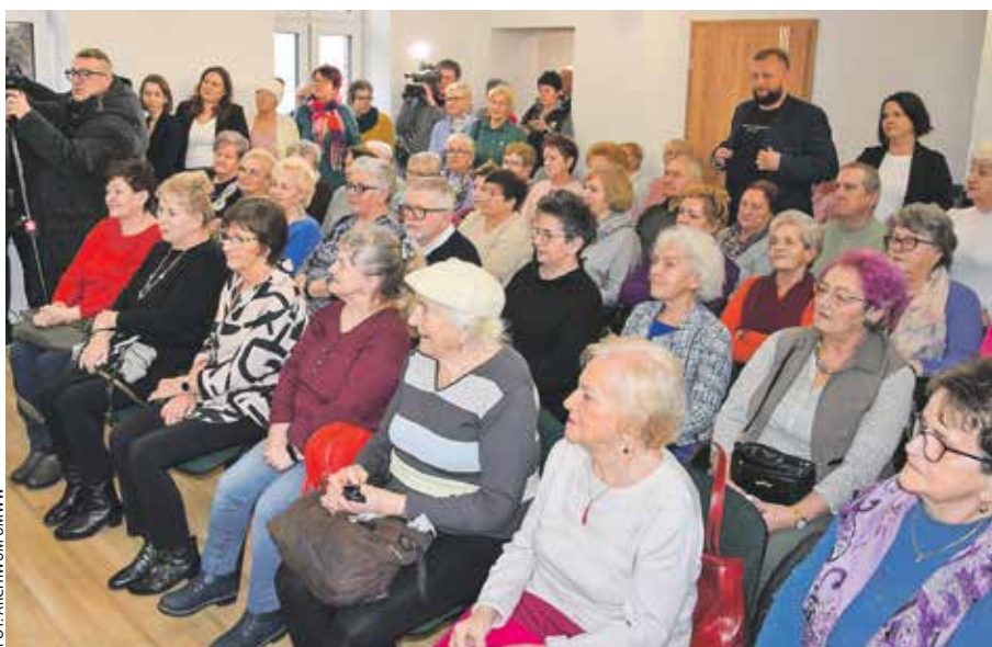
Podczas podpisywania umowy w Kostrzynie (12 lutego) nie zabrakło seniorów.

Nowe centrum wypełni się zapewne po brzegi seniorami, tym bardziej że w poprzednich latach samorząd kostrzyński realizował podobne projekty ze wsparciem unijnym. Cieszyły się one ogromnym zainteresowaniem, a wielu seniorów pojawiło się na podpisaniu umowy (co widać na załączonym zdjęciu). Chętnie opowiadali o ofercie kultu-