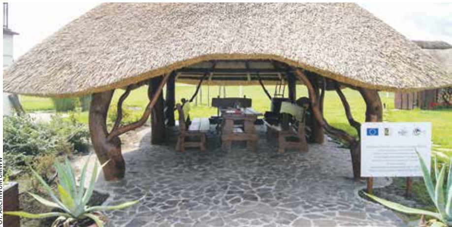
Altana ogrodowa w Janiszewie w gminie Poniec w powiecie gostyńskim.