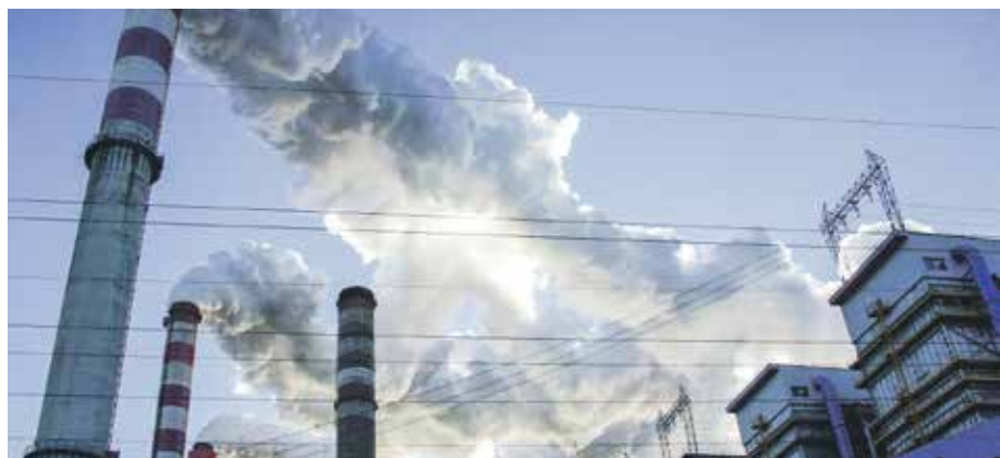
Ostatnie lata to intensyfikacja działań samorządu województwa na rzecz transformacji wschodniej części regionu.