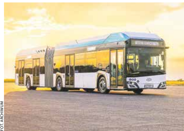
Wodorowy autobus Solarisa nagrodzono w kategorii „biznes”.

– Obecna sytuacja geopolityczna oraz zachodzące zmiany klimatu stanowią poważne wyzwanie zarówno w aspekcie środowiskowym, jak i w wymiarze społeczno-gospodarczym. Konkurs promuje wielkopolski wkład w osiągnięcie celów zrównoważonego rozwoju oraz transfer wiedzy do