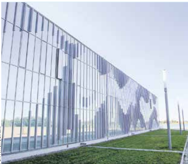
Nowy budynek Muzeum Pierwszych Piastów na Lednicy to jedna z najważniejszych inwestycji w dziedzinie kultury.

CIESZY MNIE, ŻE... zarząd województwa realizuje moje inicjatywy, projekty, interpelacje. Są nimi np. program „Deszczówka”, dofinansowanie budowy dróg lokalnych, wsparcie dla rodzinnych ogrodów działkowych i rzemiosła, a także utworzenie Samorządowego Centrum Rozwoju Wsi w Sielinku. Cieszę się, że dzięki m.in. moim staraniom lokalne grupy działania dostały dodatkowe 50 mln euro na rozwój wsi i małych miast. Cieszą mnie inwestycje samorządu: obwodnica Gostynia, zmodernizowana część drogi 305, rozpoczęcie budowy wiaduktu w Nowym Tomysku czy rozwój Kolei Wielkopolskich. Doceniam wsparcie inicjatyw lokalnych: „Wielkopolską Odnowę Wsi”, „Szatnię na medal”, „Błękitno-zielone inicjatywy...”. Jestem dumna z dynamicznego rozwoju Wielkopolski. SZKODA, ŻE... rząd PiS odebrał sejmikowi kompetencje w zakresie gospodarki wodnej i doradztwa rolniczego. Szkoda, że czas za szybko płynie.