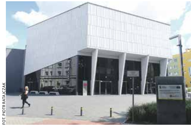
FOT. PIOTR RATAJCZAK