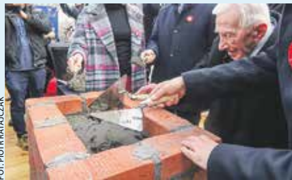
FOT. PIOTR RATAJCZAK