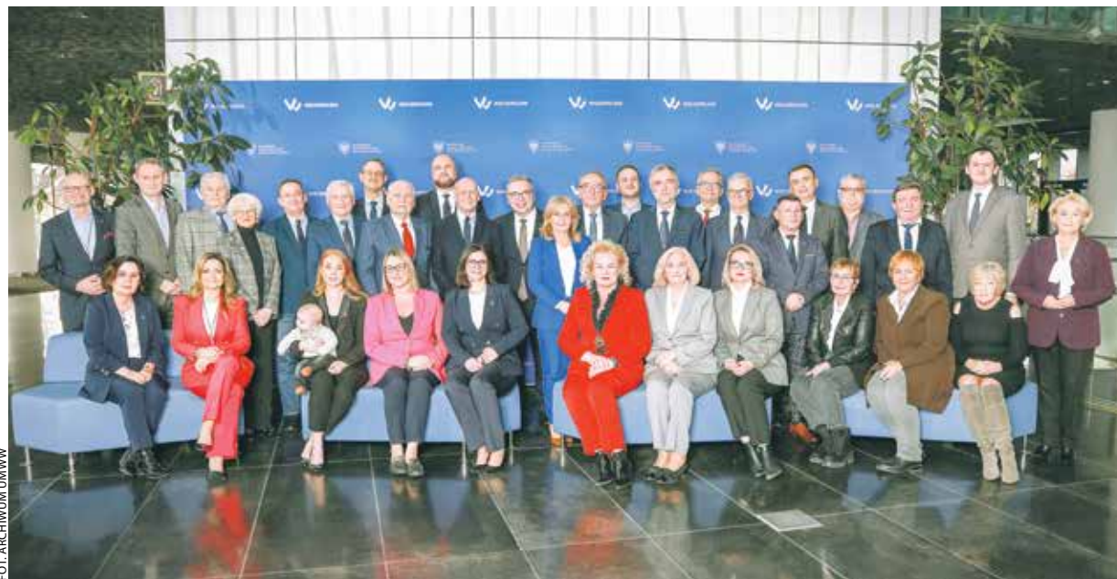
29 stycznia 2024 roku w przerwie obrad LXI sesji sejmiku radni stanęli do pamiątkowego zdjęcia.

Postawiliśmy na nowoczesny i ekologiczny transport publiczny, na ochronę klimatu, naukę i edukację, wsparcie przedsiębiorców i innowacyjność, rewitalizację miast i odnowę wsi, na e-usługi... Zainwestowaliśmy w SIEBIE, po prostu. I w nasze relacje z partnerami z Europy i świata. Po drodze nam z takimi wartościami, jak solidarność, praworządność i demokracja. To, że dziś mamy przed sobą dobrą i stabilną przyszłość, to nasz zbiorowy sukces.