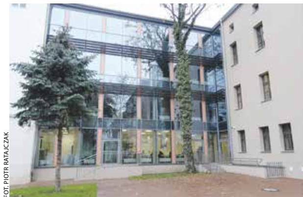
FOT. PIOTR RATAJCZAK