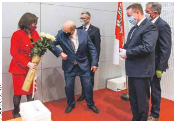
Maseczki, rękawiczki i dystans – tak wyglądały sejmikowe sesje w pierwszych miesiącach pandemii koronawirusa.

Oczywiście najważniejsza kulturalna inwestycja rozpoczęła się zaledwie kilka tygodni temu wmurowaniem kamienia węgielnego i zapewne stanie się symbolem kolejnej kadencji. Mowa o nowym Muzeum Powstania Wielkopolskiego, do któ-