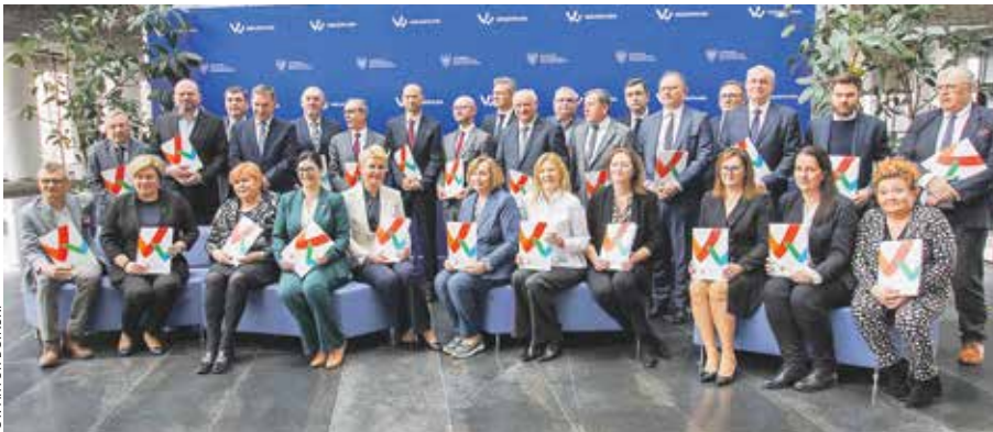
Dyrektorzy szpitali podpisali deklarację 27 lutego w UMWW.

Teraz z tych doświadczeń będzie mogło skorzystać także 29 szpitali powiatowych.