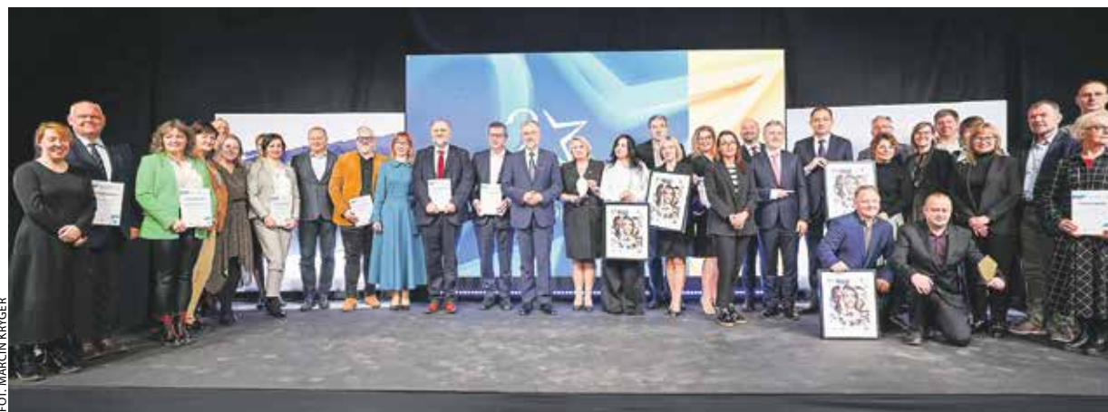
Gala zakończyła się wspólnym zdjęciem zaproszonych gości i przedstawicieli nominowanych projektów.

Podczas wydarzenia nie zabrakło nawiązania do 20-le-