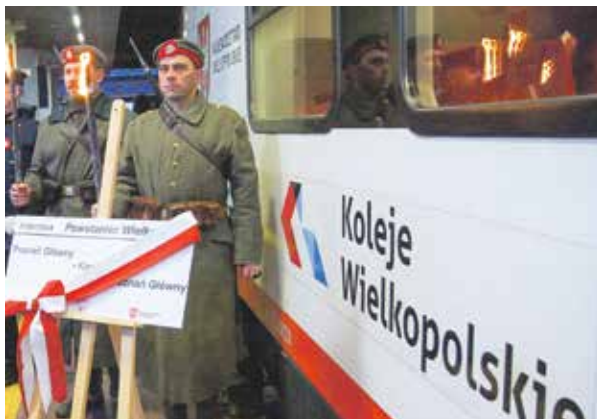
Nowoczesne pociągi i pamięć o Powstaniu Wielkopolskim to charakterystyczne elementy dla naszego województwa.