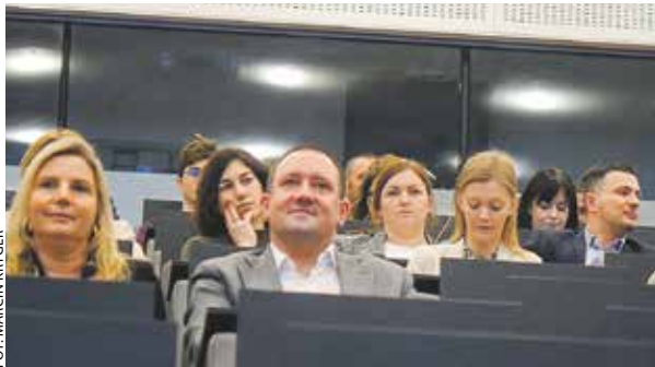
W wydarzeniu wzięli udział samorządowcy z Wielkopolski.

Wielkopolska w najbliższych latach będzie konty-