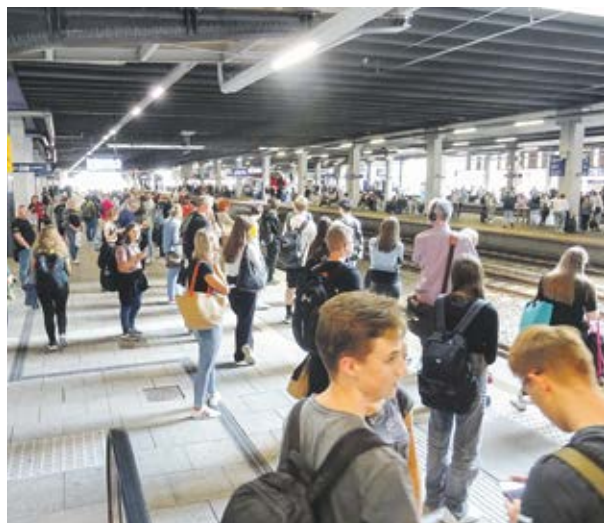
Pasażerów na kolei przybywa, zwłaszcza młodych.

W XXI wieku pasażer oczekuje od kolei punktualności, czystości i szybkiej podróży. Samorząd województwa od wielu lat konsekwentnie inwestuje znaczne pieniądze (także z UE) w zakup nowego taboru, modernizację linii kolejowych, rozwój PKM. Trudno się temu dziwić, bo prezentowany na mapce zasięg Poznańskiej Kolei Metropolitalnej daje szansę blisko dwóm milionom mieszkańców Wielkopolski na korzystanie z wygodnego i szybkiego środka transportu. ■