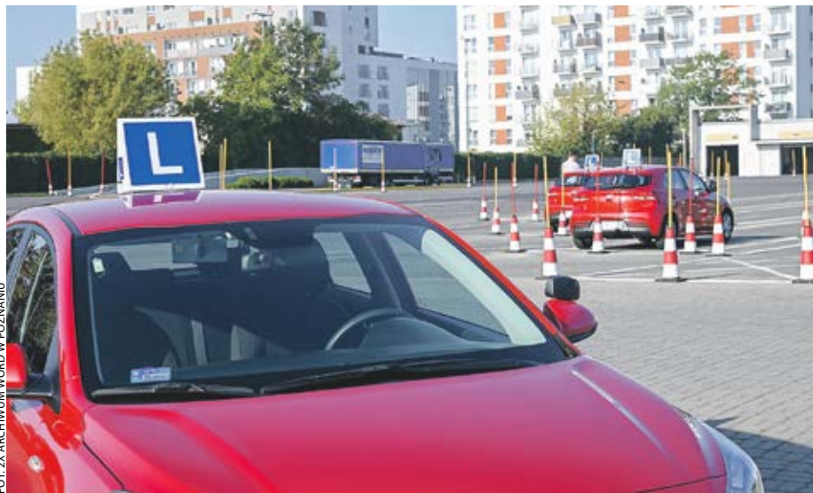
Podstawową działalnością WORD-ów jest prowadzenie egzaminów na prawo jazdy.

Wojewódzkie ośrodki ruchu drogowego funkcjonują w Wielkopolsce od ćwierćwiecza.