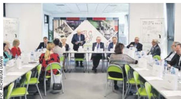
Wojewódzka Rada Rynku Pracy spotkała się 26 września.

26 września w siedzibie Zespołu Szkół Technicznych w Tarnowie Podgórnym odbyły się obrady Wojewódzkiej Rady Rynku Pracy.