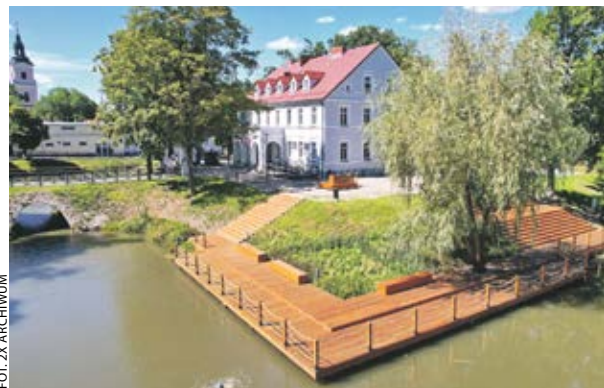
Po rewitalizacji centra zarówno Krobi...

Jak zmieniły się – po rewitalizacji wspartej z WRPO 2014+ – centra Krobi i Baranowa?