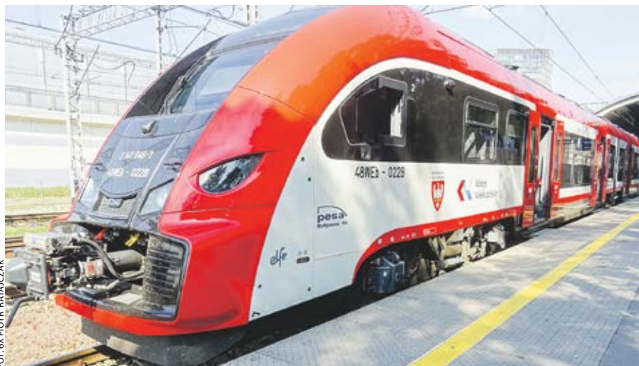
Nowoczesne „elfy” z logo PKM jeżdżą na najbardziej obleganych trasach.

W tym roku w ramach PKM (obsługiwanej przez