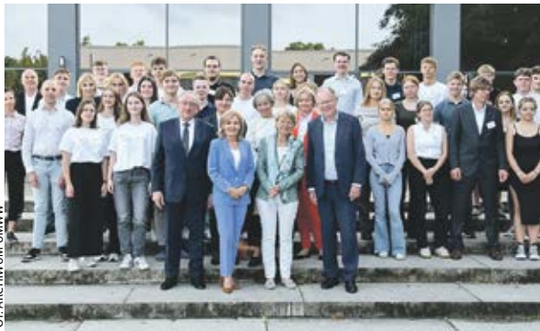
O rozwoju Europy politycy dyskutowali w Hanowerze z młodzieżą z trzech regionów.