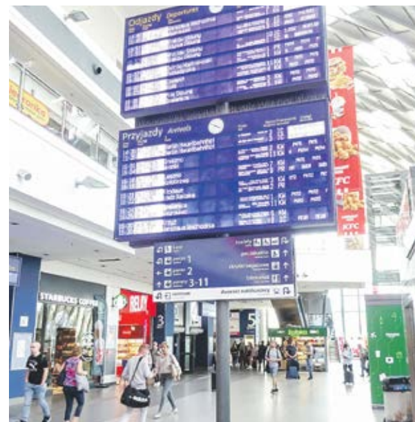
W godzinach szczytu pociągi kursują co 30 minut.

Pamiętamy też o zadaniu na nową kadencję, tj. o rozwoju kolei w aglomeracji kalisko-ostrowskiej.