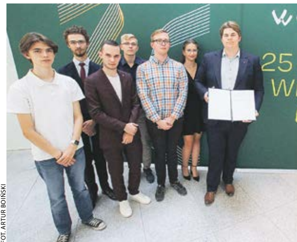
Członkowie Komisji Regulaminowej i przewodniczący młodzieżowego sejmiku prezentują efekty swoich prac.

Pierwsza została zorganizowana w czerwcu, a kolejna jest zaplanowana na 20 października i posiedzeń komisji, oprócz przyjęcia wspomnianego regulaminu – 39 młodzieżowych radnych ma również wybrać składy i przewodniczących 7 komisji merytorycznych, w których będą pracować członkowie MSWW. ABO