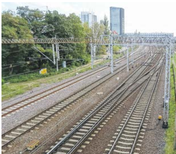
Pięć linii PKM obsługuje 9 tras wychodzących z Poznania.