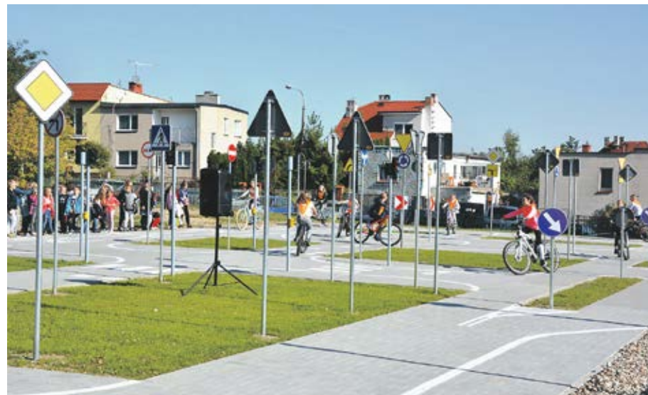
Ośrodki finansują m.in. wyposażenie dla rowerowych miasteczek ruchu drogowego.

Obecnie w całym kraju działają 43 ośrodki, w których przez 25 lat przeprowadzono ponad 60 mln egzaminów. W Wielkopolsce z powodzeniem funkcjonuje 5 ośrodków ruchu drogowego: w Kaliszu, Lesznie, Koninie, Pile i w Poznaniu. Zorganizowano w nich łącznie prawie 2,7 mln egzaminów teoretycznych oraz 4,5 mln praktycznych, zakończonych wydaniem ponad 1,6 mln praw jazdy wszystkich kategorii.