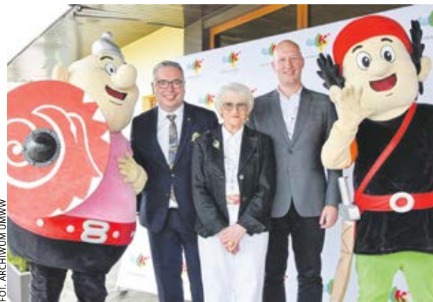
Na Szlak Piastowski, także w Pызdrach (jak na zdjęciu z 22 września) zapraszają m.in. Kajko i Kokosz.

Kapituła konkursu poinformowała, że tytuły najlep-