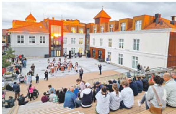
...jak i Baranowa prezentują się efektownie.

– Porównując do wielu innych projektów, musimy powiedzieć, że to jest jeden ze wzorcowych przykładów, jeśli chodzi o jego przemysł, koncepcję i wykonanie. Wła-