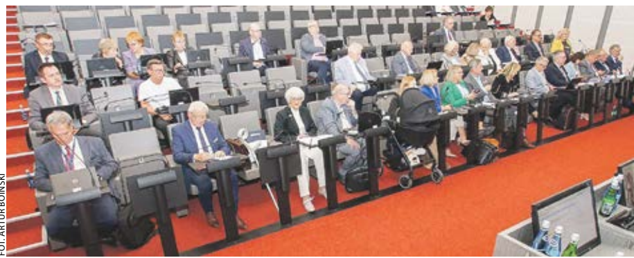
Zapropozowane przez klub PiS stanowisko nie znalazło poparcia większości radnych.

gorąca dyskusja poprzedziła na wrzesniowej sesji odrzucenie przez sejmik zaproponowanego przez PiS stanowiska o zbrodniach niemieckich i reparacjach.