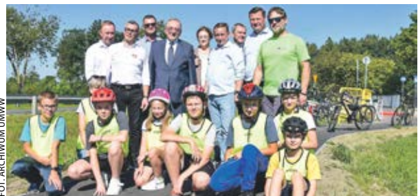
W gminie Lipka podsumowano zakończoną budowę ścieżki rowerowej wzdłuż DW 188.

Wicemarszałek Wojciech Jankowiak podsumował we wrześniu kolejne inwestycje realizowane na wielkopolskich drogach.