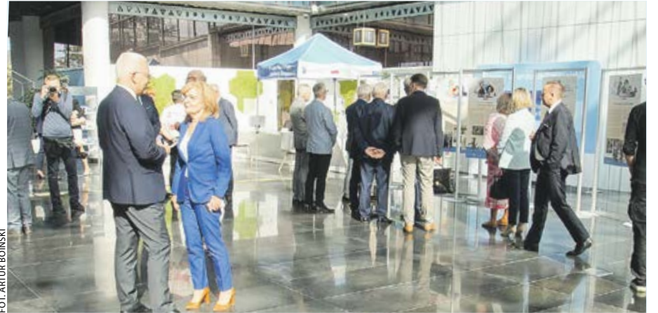
Dwie okolicznościowe wystawy na patio Urzędu Marszałkowskiego w Poznaniu otwarto uroczście 25 września podczas sesji sejmiku województwa.

Druga wystawa pt. „Zamoyska-Szymborska. Wielkie Kobiety 2023” (zaprezentowana przez Fundację „Zakłady Kórnickie”) opowiada z kolei o Jadwidze Zamoyskiej i Wisławie Szymborskiej. Ich krótki życiorys opisał kolejno podczas sesji sejmiku: przewodnicząca izby