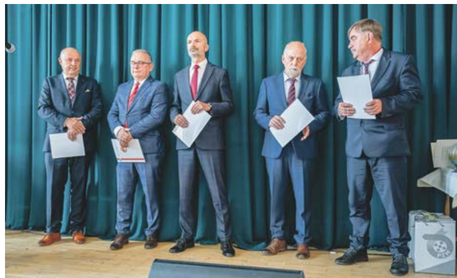
4 września wyróżniono m.in. pięciu wielkopolskich dyrektorów WORD-ów.