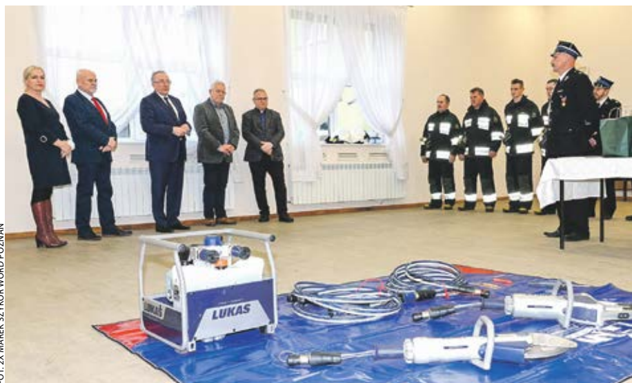
Na wsparcie w postaci sprzętu mogą liczyć też jednostki ochotniczej straży pożarnej.