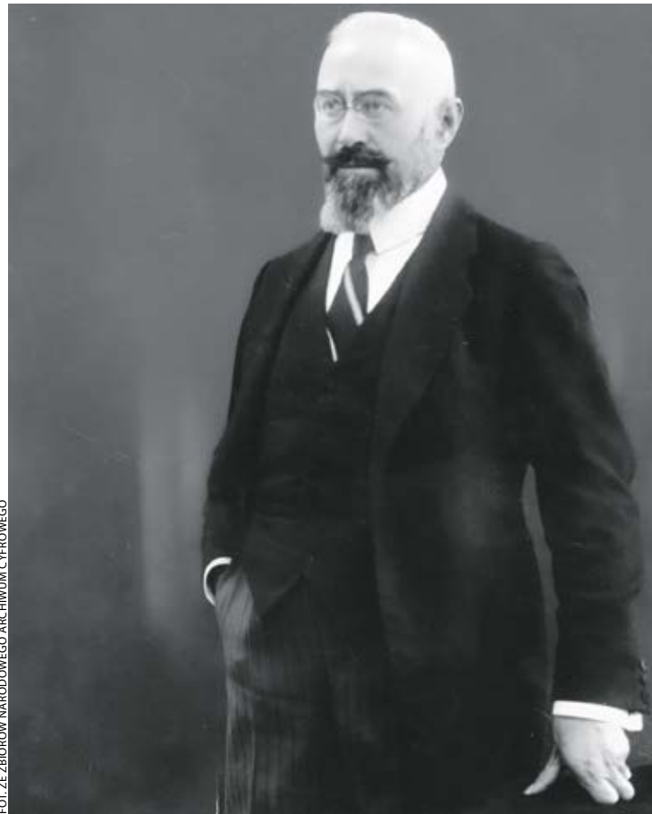
Konsekwentny i uparty, nie zawsze skłonny do kompromisu, autentycznie kierował i rządził.

Podpisanie traktatu wersalskiego pozwoliło usunąć te formalne przeszkody i można było pomyśleć już o etapach scalenia Wielkopolski z Rzeczpospolitą. Dnia 1 sierpnia 1919 roku ustalono zasady tymczasowej organizacji zarządu byłej dziel-