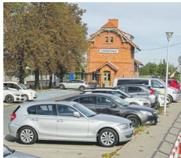
Węzeł przesiadkowy powstał m.in. w Czerwonaku.