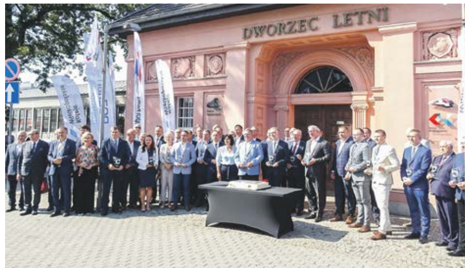
11 września na Dworcu Letnim w Poznaniu obchodzono jubileusz 5-lecia PKM.