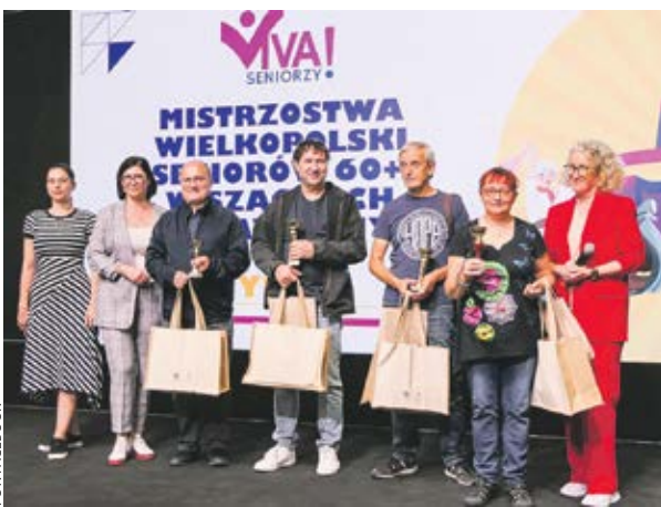
Zwycięzcy turnieju o tytuł Mistrza Wielkopolski Seniorów w szachach błyskawicznych 60+.

W programie nie zabrakło ciekawych warsztatów (m.in. cyfrowych, o bezpieczeństwie, tworzeniu toreb na zakupy czy biżuterii, wyplataniu makramy, tkaniu), wykładów (na temat opieki se-