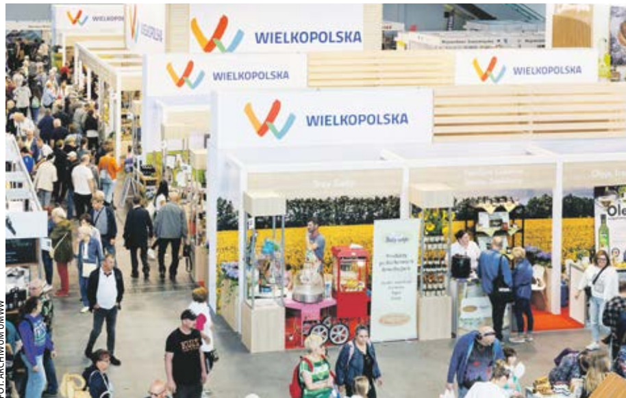
Wielkopolskie stoisko – jak zawsze – wyróżniało się spośród targowych prezentacji.

W jego ramach zorganizowano specjalne pokazy, które