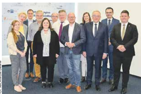
Uczestnicy frankfurckiego zgromadzenia PURPLE.

– Rozmowy dotyczyły między innymi możliwości pozyskania funduszy europejskich w programach unijnych na rzecz obszarów podmiejskich, oczywiście z uwzględnieniem naszego województwa. Podkreślono znaczne wysiłki grup roboczej i lobbingowej w ramach sieci PURPLE, w których to aktywnie działają Wielkopolskie Biuro Planowania Prze-