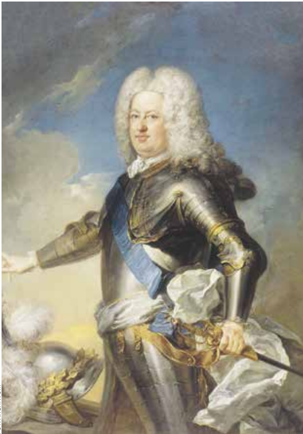
Tak na portrecie z 1728 roku Stanisława Leszczyńskiego uwiecznił francuski malarz pochodzenia holenderskiego Jean Baptiste van Loo.

Stanisław Leszczyński urodził się 23 października 1677 roku we Lwowie, był jedynym synem wojewody poznańskiego Rafała Leszczyńskiego i Anny z Jabłonkowskich. Wychowywał się w Lesznie, w rodzinie znanej z tolerancyjnych przekonań, w atmosferze sprzyjającej innowiercom, którzy już od dawna właśnie tam znaleźli swoją ostoję – co prawda mocno nadszarpniętą wydarzeniami „potopu” szwedzkiego. W sumie siedemnastowieczne Leszno było ośrodkiem myśli postępowej, reformatorskiej, uwzględniającej doświadczenia innych krajów i różnych myślicieli. Nic więc dziwnego, że w takim środowisku wyrósł król intelektualista.