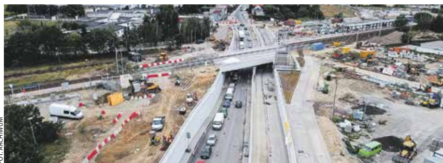
Podróżujący w tej części aglomeracji poznańskiej już odczuwają korzyści z wykańczanego jeszcze węzła komunikacyjnego na granicy Poznania i Plewisk.