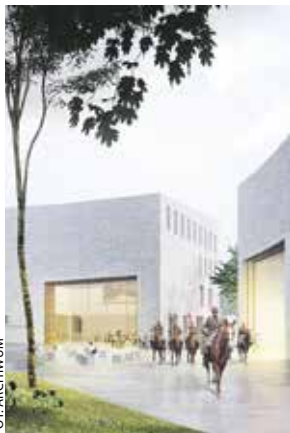
Wizualizacja nowej siedziby muzeum.