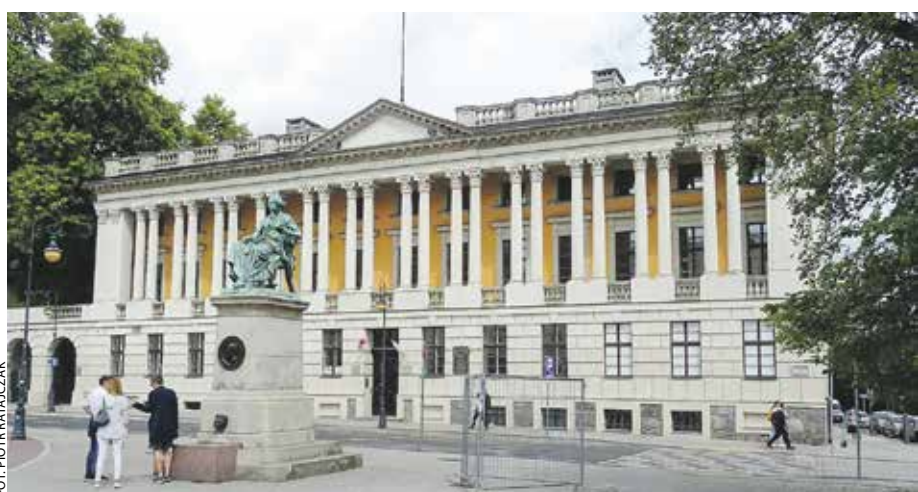
Bibliotekę Raczyńskich w Poznaniu założył w 1829 r. hrabia Edward Raczyński.