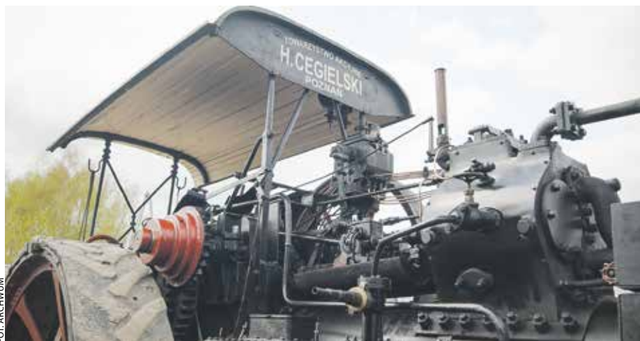
Maszynę „Hipolina” H. Cegielskiego obejrzymy w muzeum w Szreniawie.