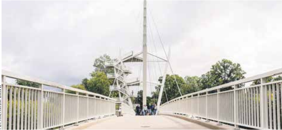
Nowa atrakcja turystyczna znajduje się na terenie gminy Czerwonak.

Jakie atrakcje zapewnia kładka pieszo-rowerowa w Owińskach, którą otwarto pod koniec lipca?