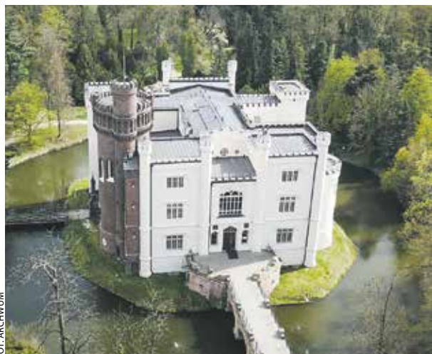
Działyńscy, Zamoyscy – w zamku w Kórniku mieszkało kilka znacznych rodów.