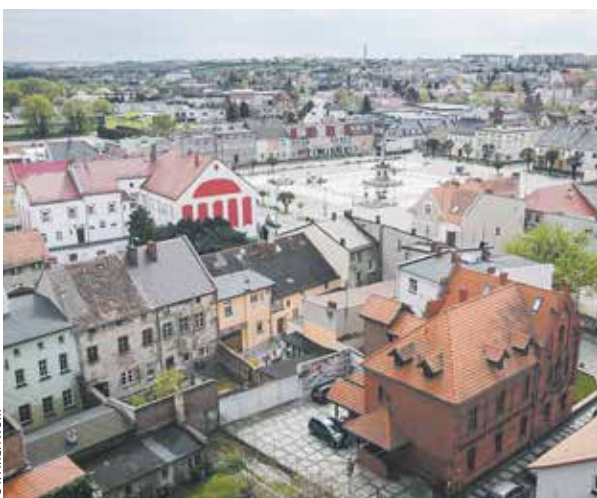
Partnerem kulturalnego projektu jest też Muzeum w Gostyniu.