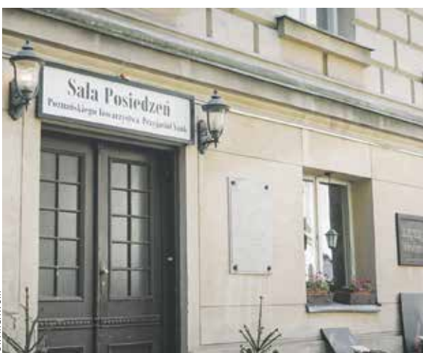
PTPN w Poznaniu zajmuje się m.in. badaniem pracy u podstaw.