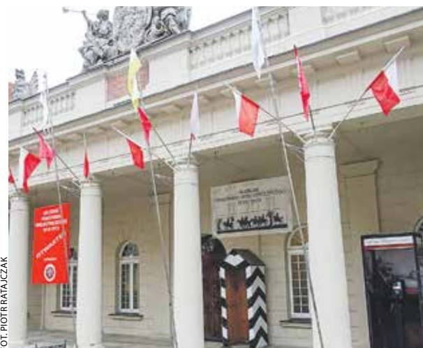
Na szlaku nie zabrakło Muzeum Powstania Wielkopolskiego.