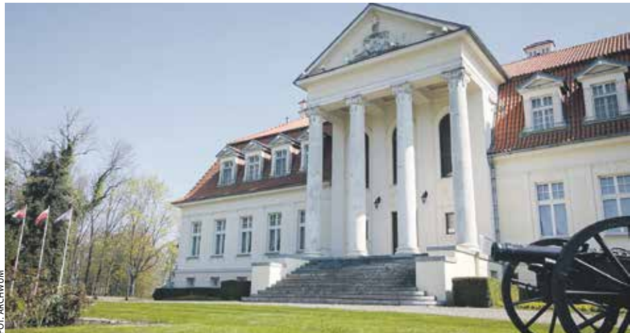
Koordinatorem szlaku jest Pałac Generała Dąbrowskiego w Winnej Górze.

W czerwcu w Bazarze Poznańskim zainaugurowano nową inicjatywę kulturalną, zrzeszającą różne jednostki związane z pracą