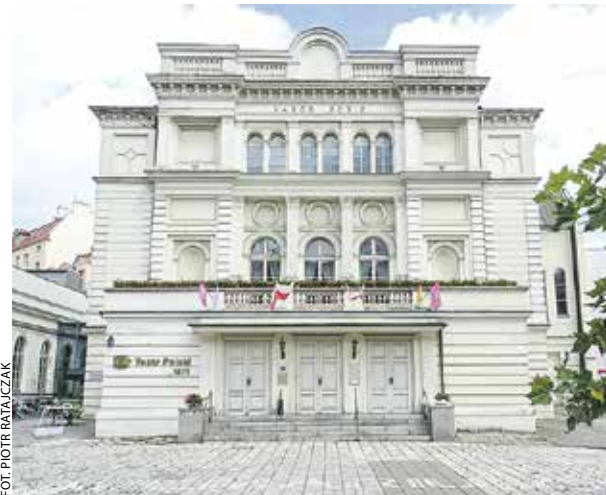
Wśród 14 lokalizacji szlaku znajdziemy Teatr Polski.