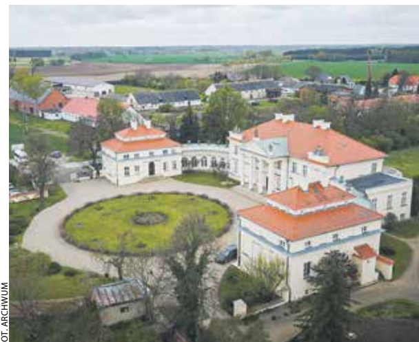
Na nowym szlaku znajduje się też Muzeum Adama Mickiewicza w Śmiełowie.

Gdzie znajdziemy miejsca związane z życiem i działalnością organiczników?