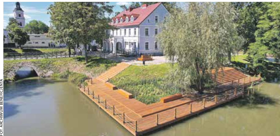
Wyspa Kasztelańska stała się jedną z perełek architektonicznych Krobi.

To niejedynie zmiany. Zmodyfikowano obszar wokół budynku i fosa. Urządzono tere-