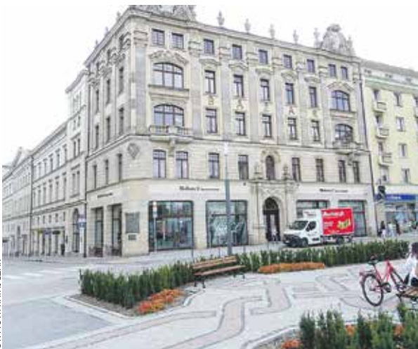
Bazar Poznański to jeden z najważniejszych symboli Poznania i Wielkopolski.