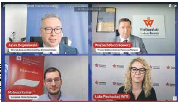
Spotkanie miało przybliżyć firmom możliwość ekspansji w Izraelu.

4 lipca odbyło się spotkanie online „Doing business in Israel”, organizowane przez Wielkopolski Fundusz Rozwoju.