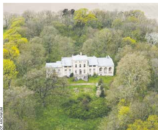
Pałac w Pakosławiu powstał pod koniec XVIII w. w miejscu dworu.