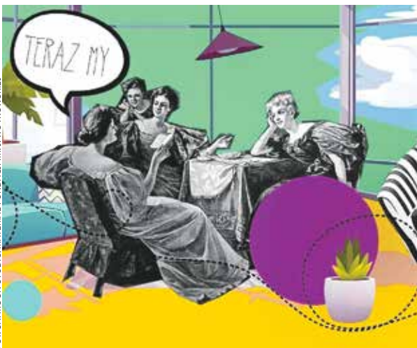
Szlak przypomni też historię wielkopolskich organiczników.