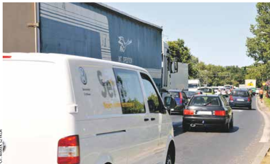
Planując podróż, zapoznajmy się z informacjami o planowanych i trwających remontach dróg.

Zdarza się jednak, że nie potrafimy wykorzystać wyposażenia naszego pojazdu, by zapewnić jak najwyższy komfort jazdy. Latem, w gorące dni, ważne jest prawidłowe używanie klimatyzacji, nawiewu, a także regularne wietrzenie auta. Dobieramy właściwą temperaturę, aby nasze samopoczucie było jak najlepsze.