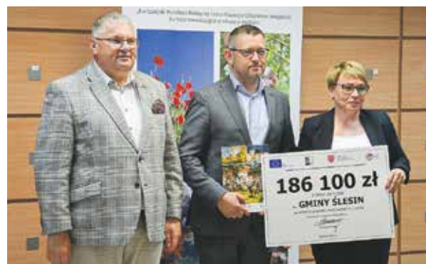
186 tys. zł z UE gmina Ślesin zainwestuje w miejscową plażę, budując tam nowoczesną infrastrukturę dla turystów.

zarówno młodzi, jak i dorośli mieszkańcy gminy. Na ten cel przyznano eurofundusze