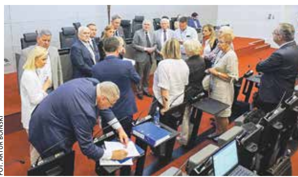
Komisje opiniowały projekt podczas obrad w sali sesyjnej.

Funkcjonowanie punktów jest finansowane ze środków unijnych, w ramach tzw. pomocy technicznej. W myśl umowy, zawartej przez marszałka z ministrem funduszy i polityki regionalnej, przy UMWW w Poznaniu prowadzony będzie, jak dotąd, główny punkt informacyjny,