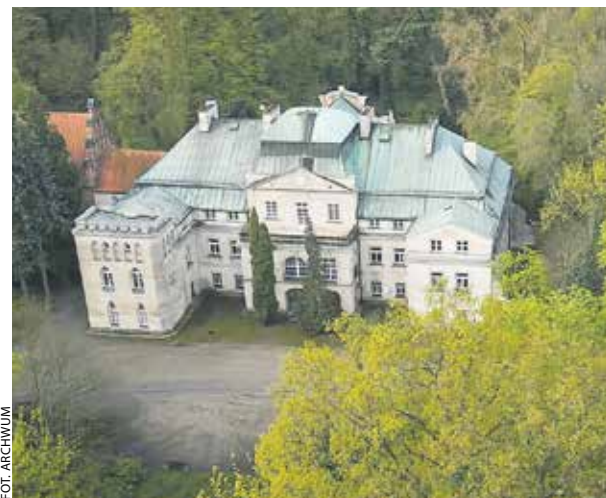
Pałac w Turwi znany jest jako siedziba gen. D. Chłapowskiego.