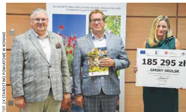
Gmina Skulsk pozyskała dofinansowanie z PROW w kwocie 185 tys. zł na budowę pomostu na Jeziorze Skulskim.

W gminie Rychwał będzie inaczej, bo stawia ona na poprawę infrastruktury kultural-