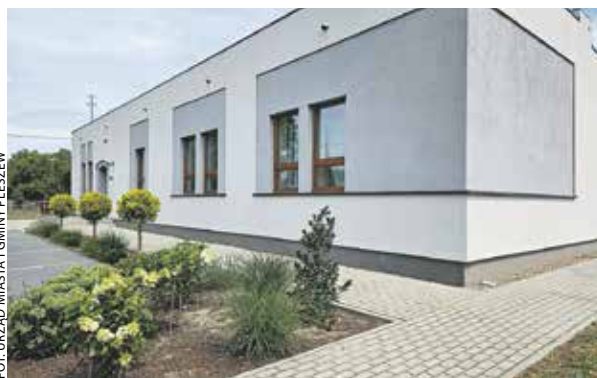
Sala wiejska w Pacanowicach, dofinansowana z PROW.

Efektom tego spotkania były trzy stanowiska (pisałyśmy o nich w poprzednim wydaniu „Monitora”) w formie apelu do ministra rolnictwa i rozwoju wsi o podjęcie bardziej zdecydowanych dzia-