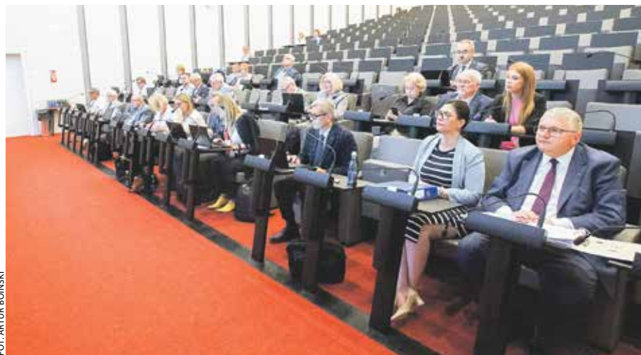
Obraujący w lipcu sejmikowi radni zadecydowali o przyznaniu wielkopolskim gminom i powiatom kilkudziesięciu milionów złotych.

Z kolei do 15 JST z regionu trafi prawie 1,5 mln zł w ramach kolejnej odsłony wojewódzkiego programu „Deszczówka”. Przypomnijmy, że chodzi w nim o inwestycje, które pomogą retencjonować wody opadowe