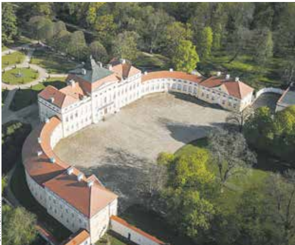
Pałac w Rogalinie powstał z inicjatywy Kazimierza Raczyńskiego.

Plany zakładają ponadto wyznaczenie (nie budowę) tras rowerowych, pieszych czy tematycznych między obiektami szlaku, co docelowo pozwoliłoby pozycjonować się także jako szlak turystyczny, którym można będzie zwiedzać Wielkopolskę. To o tyle istotne, że uła-